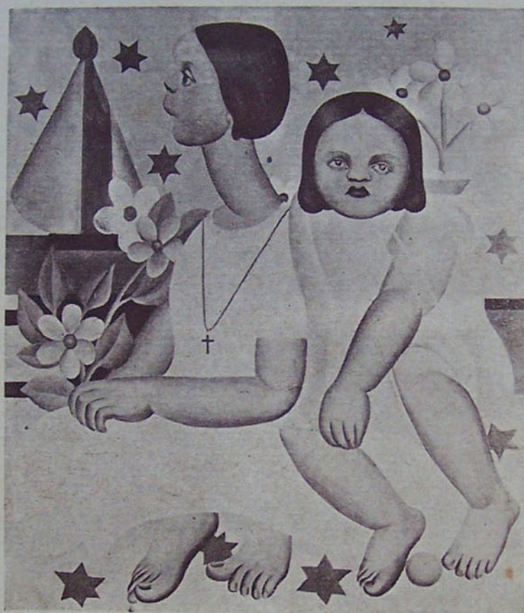
(Tarsila do Amaral: «Quadro»)

PORTUGAL — BRASÍL IBERO — AMERICANISMO A · R · T · E